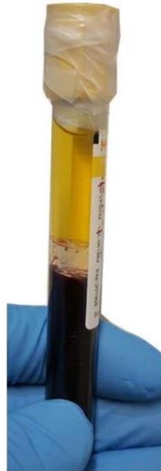
بعد از سانتریفیوژ

تصویر 3: لوله SST قبل از سانتریفیوژ و بعد از آن، پس از سانتریفیوژ لخته در پایین لوله، سرم در بالای آن قرار و ژل در بین آن دو قرار خواهد گرفت.