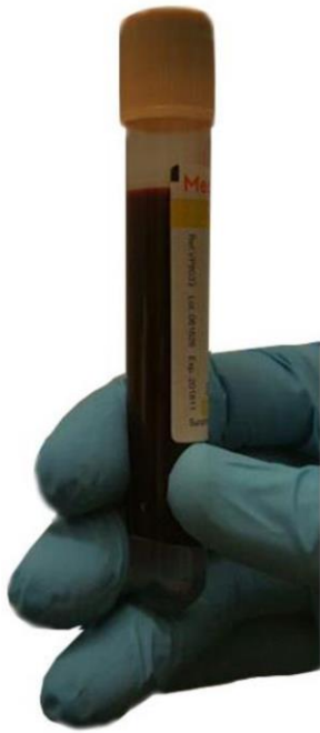
قبل از سانتریفیوژ