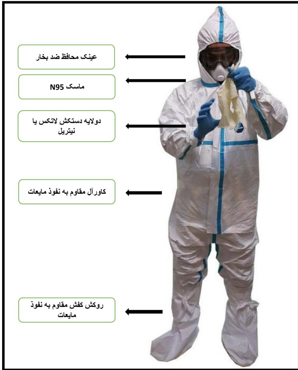
تصویر 1) تجهیزات حفاظتی استاندارد برای تب های خونریزی دهنده ویروسی

2-1-4) در صورتیکه با دو نمونه اول و دوم تشخیص آزمایشگاهی موفقیت آمیز نبود، نمونه سوم (C) با فاصله 5 روز از نمونه دوم درخواست می گردد.