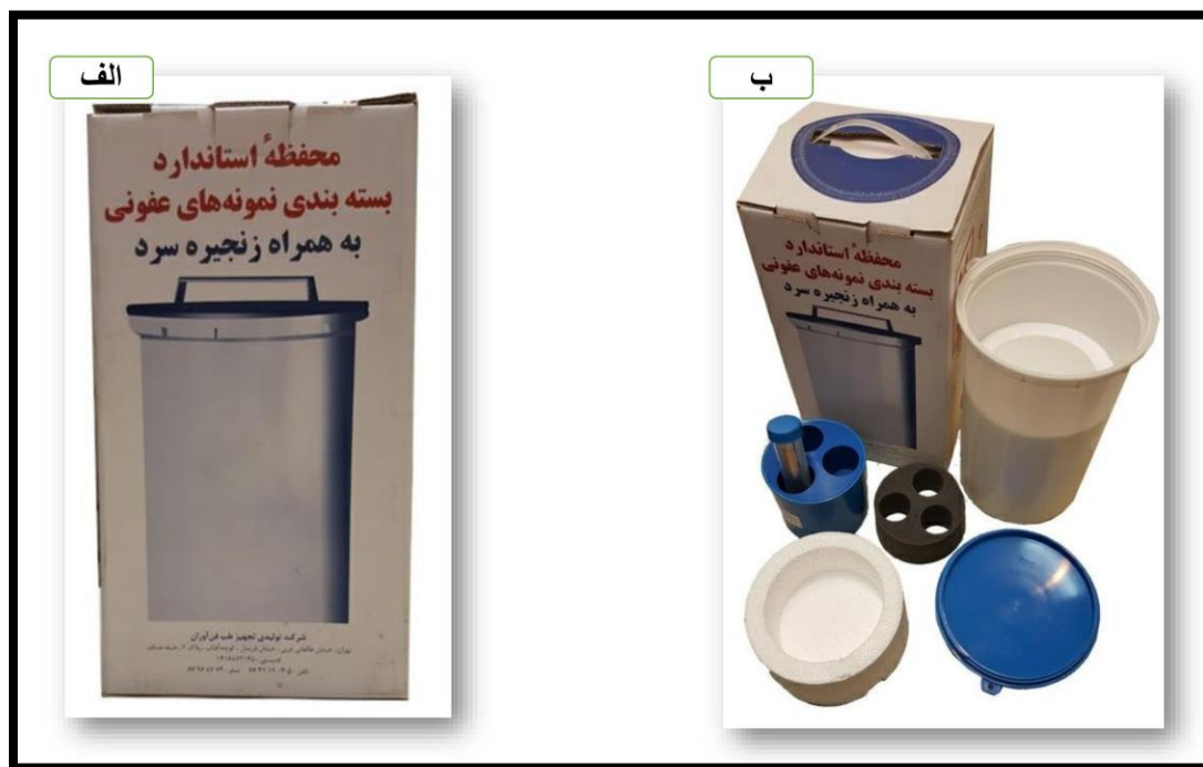
تصویر 4: محفظه استاندارد بسته بندی و ارسال نمونه های عفونی. الف) نمای بیرونی، ب) اجزای محفظه.