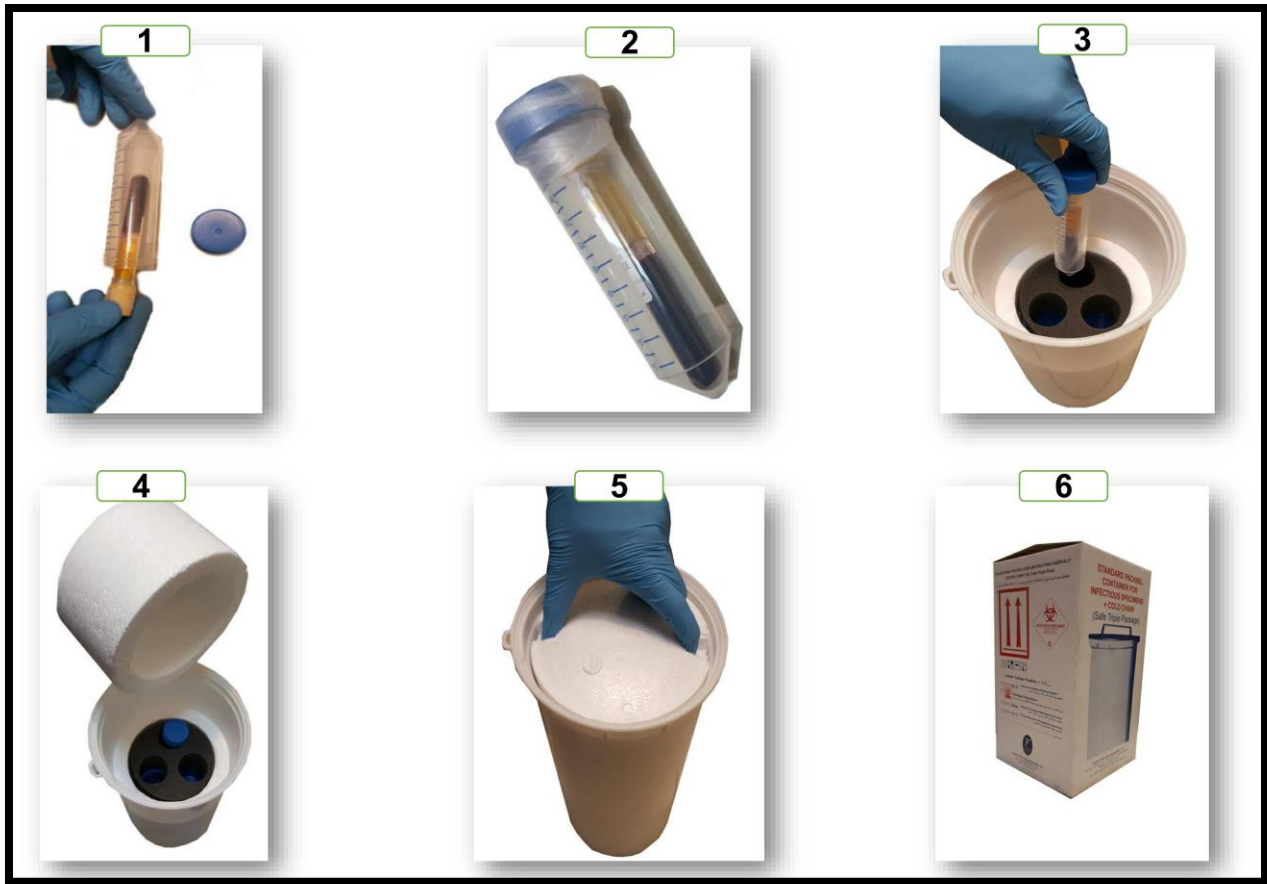
تصویر 5: مراحل بسته بندی نمونه